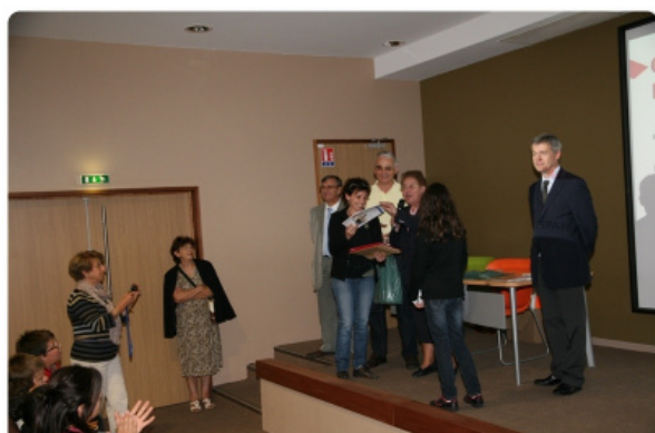
Remise des prix des D.D.E.N