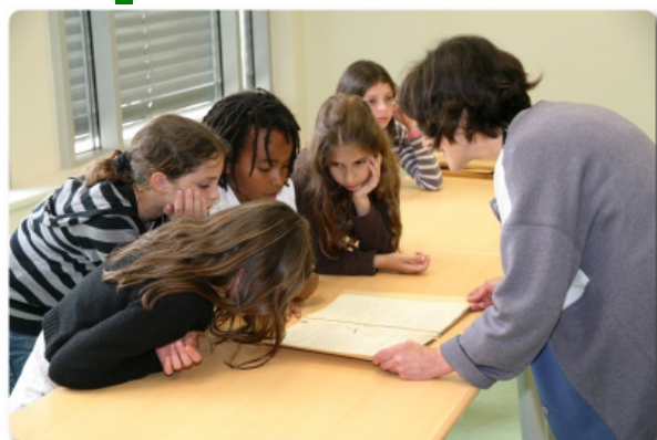
Consultation des documents aux Archives

de l'Education Nationale Gironde puis elle a été présentée à l'école pendant notre fête et à la Communauté de Communes Médullienne à Brach.