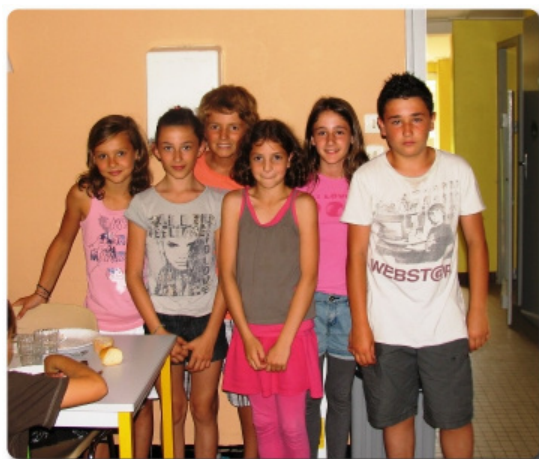
Les futurs 6ème